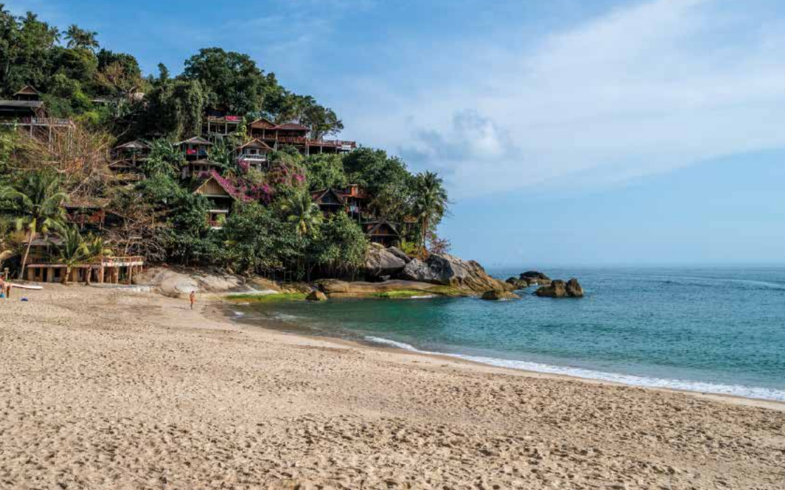
Der idyllische Than Sadet Beach auf Koh Phangan

zeit gänzlich auszukosten und mehr Freiräume für spontane Erlebnisse zu schaffen. So kann jede Reise nach Thailand ihre eigenen Geschichten schreiben und zahlreiche Gelegenheiten bieten, Land und Leute bewusst kennenzulernen.