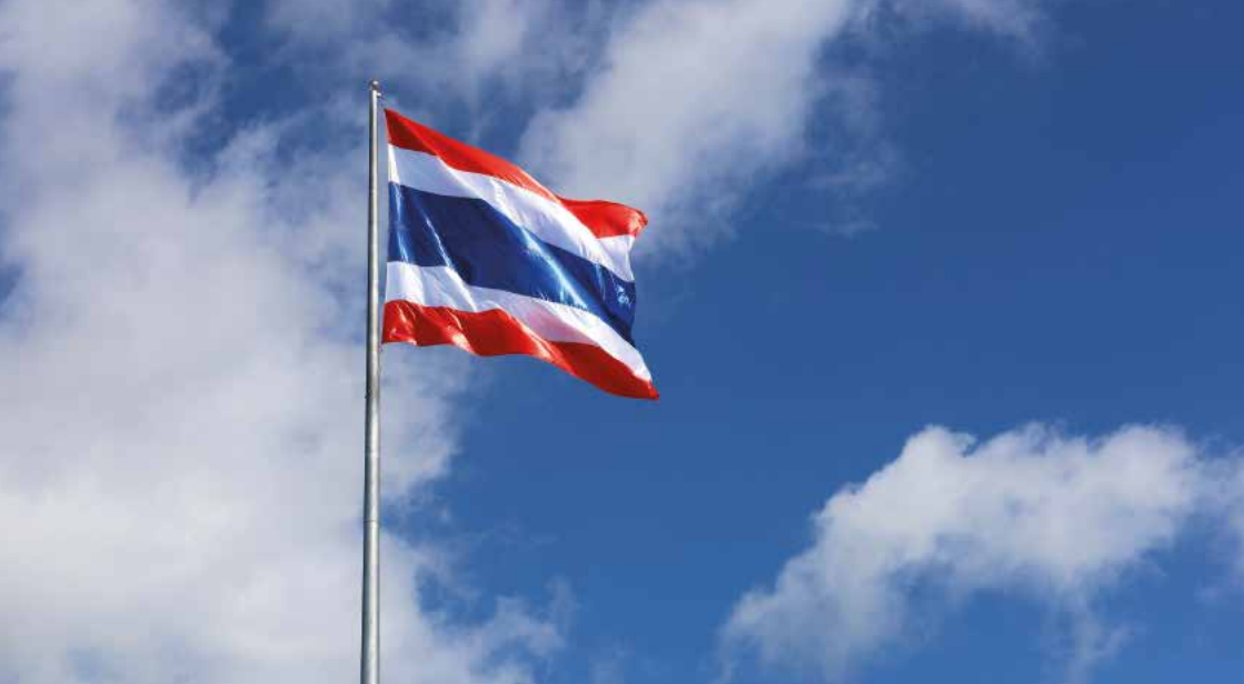
Die Flagge Thailands