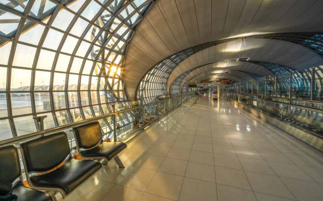
Flughafen Suvarnabhumi in Bangkok