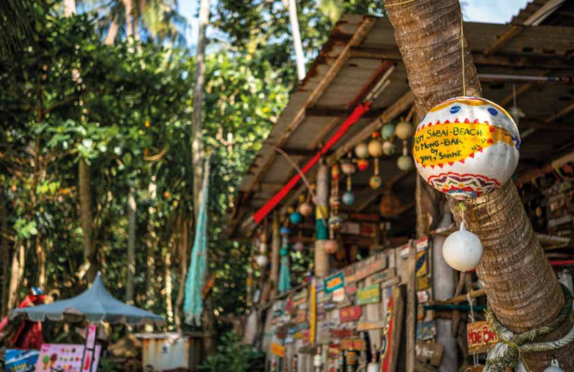
Strandbar am Charlie Beach auf Koh Mook